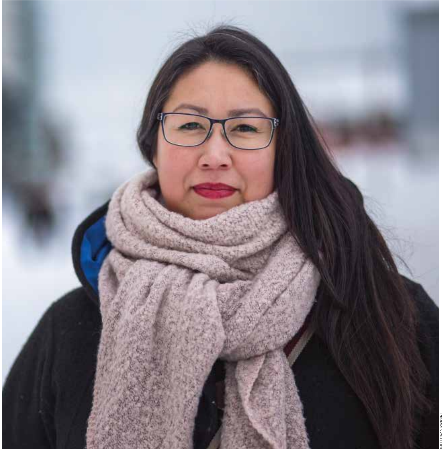
Arnajaaq Lyngep Islandimi West Nordic Studiesimi semesteri naammassigamiuk Nuummur utersimalerpoq.

Unamminartoq alla tassaavoq ani-ngaasaqarniarneq. Ueqaraannimi arla-