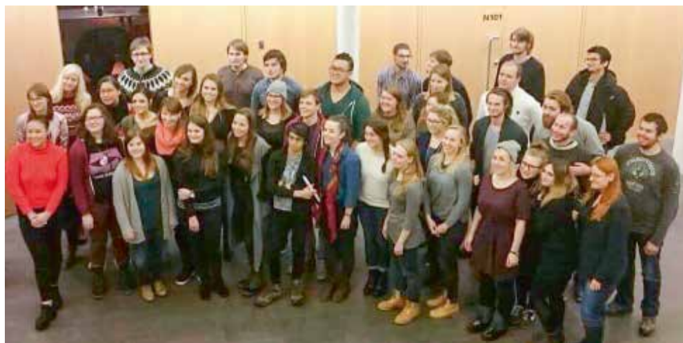
West Nordic Studiesimi ilinniarfik Háskólinn á Akureyri, University of Akureyri, Island-imiitooq.